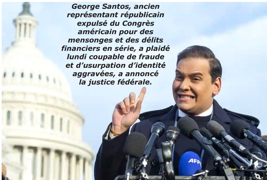
George Santos, ancien représentant républicain expulsé du Congrès américain pour des mensonges et des délits financiers en série, a plaidé lundi coupable de fraude et d'usurpation d'identité aggravées, a annoncé la justice fédérale.

Le ministère de la Justice a précisé dans un communiqué que M. Santos risque «un minimum de deux ans de prison et un maximum de 22 années de prison» et qu'il devra payer au total quelque 578.000 dollars d'amendes.