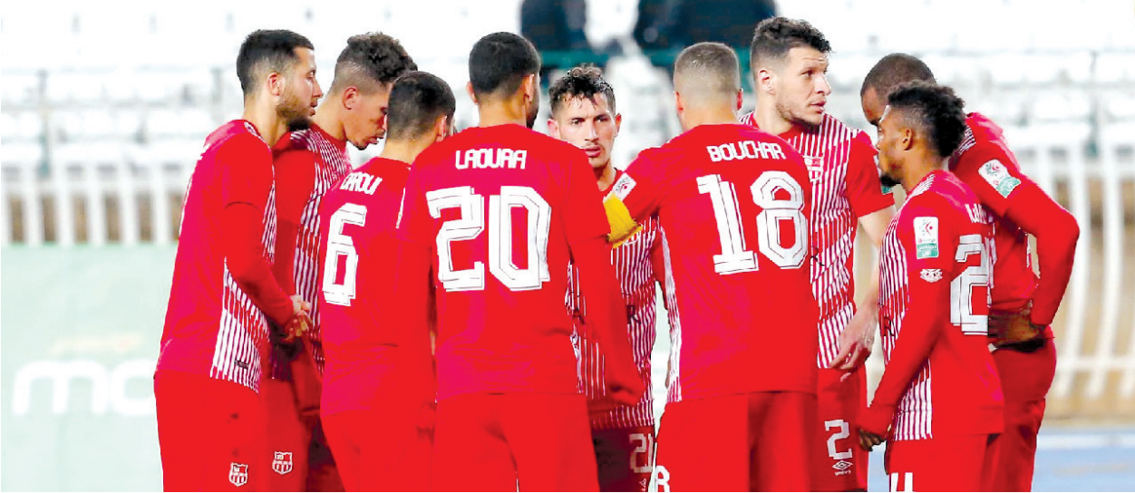
La Fédération algérienne de football (FAF), a apporté des modifications au programme des 1/32es de finale de la Coupe d'Algérie de football 2024-2025, dont les matchs se joueront entre le 30 décembre 2024 et le 16 janvier 2025 :

Lundi, 30 décembre 2024 : Stade du 5-juillet (Alger) : ES Ben Aknoun (L2) - MC Alger (L1) 19h00 Mercredi, 1 janvier 2025 : Stade de l'Unité maghrébine (Béjaïa) : Olympique Akbou (L1) - CSConstantine (L1) 15h00 Judi, 2 janvier 2025 : Stade du 20-août 1955 (Béchar) : JS Saoura (L1) - USM Khenchela (L1) 15h00 Vendredi, 3 janvier 2025 : Stade du 24 février (Sidi Bel-Abbès) : USM Bel-Abbès (Inter-régions) - JS Azazga (Inter-régions) 15h00 Stade d'Aïn Témouchent : CR Témouchent (L2) - CA Batna (L2) 14h30 Stade du 1er-novembre (Batna) : ES Bouaâkeul (Inter-régions) - CR Béni Tamou (Inter-régions) 14h30 Stade des frères Brakni (Blida) : USM Blida (Inter-régions) - IRB Sedrata (Inter-régions) 14h30 Stade Souidani Boudjemaâ (Guelma) : ES Guelma (Inter-régions) - JS Kabylie (L1) 14h30 Stade du Commandant Ferradj (Mostaganem) : ES Mostaganem (L1) - WM (Inter-régions) 16h00 Tissemsilt (Inter-régions) 16h00 Stade Gaid Ahmed (Tiaret) : JSM Tiaret (L2) - ES Théniet El-Abed (Régionale 2) 14h30 Stade Habib Bouakeul (Oran) : IRB El Kerma (Inter-régions) - ASO Chlef (L1) 14h30 Stade du 19-mai 1956 (Annaba) : USM Annaba (L2) - CRB Aïn Yagout (Inter-régions) 15h00 Stade de l'Unité maghrébine (Béjaïa) : MO Béjaïa (Inter-régions) - AS Khroub (L2) 15h00 Stade du 1er-novembre (El-Harrach) : JS Haï Djabel (Inter-régions) - ORB Oued Fodda (Inter-régions) 14h30 Stade Colonel Chaâbani (Touggourt) : NRB Touggourt (Inter-régions) - RC Bougaâ (Inter-régions) 14h30